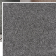
860 / Fame Enso / Gravier